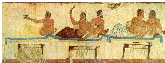
Afresco em Paestum Cena de banquete.