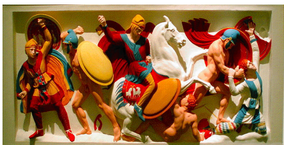
Reconstituição da policromia do com Sarcófago de Alexandre