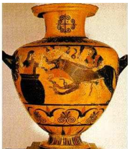
Anfora decorada com Euristeu, Cérbero e Hércules Museu do Louvre, Paris

Os gregos antigos se destacaram muito no mundo das artes. As esculturas, pinturas e obras de arquitetura impressionam, até os dias de hoje, pela beleza e perfeição. Os artistas gregos buscavam representar, através das artes, cenas do cotidiano grego, acontecimentos históricos e, principalmente, temas religiosos e mitológicos